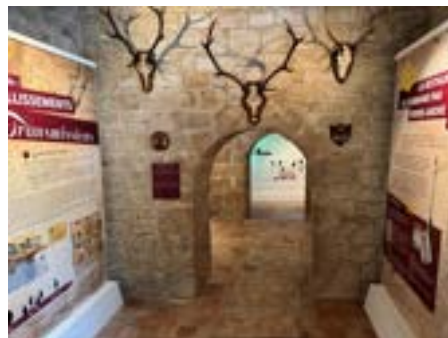
10 Château d'Auvers, Mémoire d'un domaine vivant , exposition