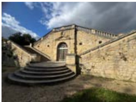
9 Orangerie sud