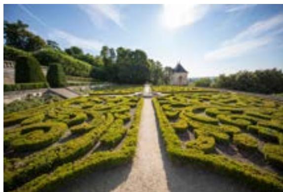
4 Jardins, Château d'Auvers (2018)