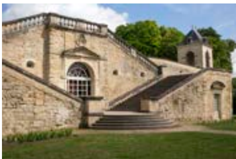
1 Orangerie sud