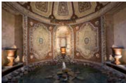
5 Nymphée, grotte, 2018, Château d'Auvers