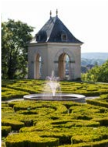
7 Pavot