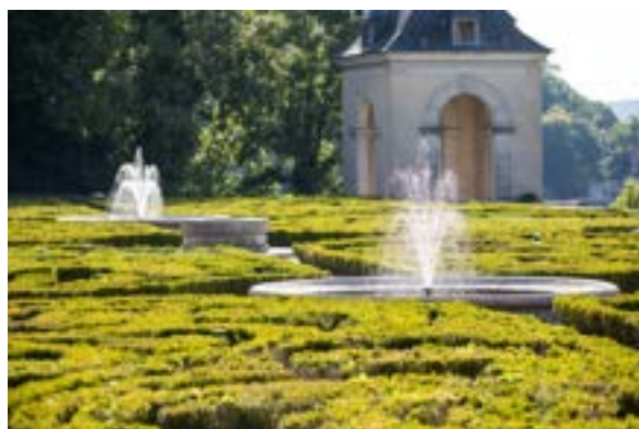
6 Château d'Auvers, Fontaine Neptune, département du Val-d'Oise