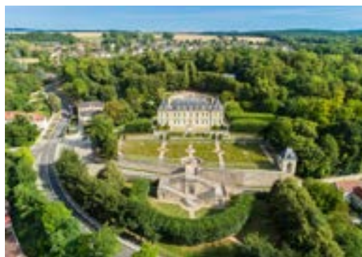
2 Château d'Auvers, drone (2018)