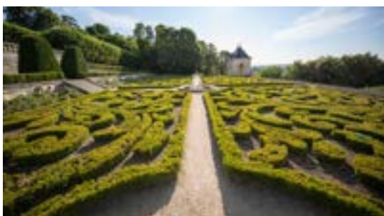
Jardins, Château d'Auvers (2018)

Ces changements successifs témoignent de l'importance accordée à la nature et au paysage dans l'architecture du château. Chaque génération a souhaité marquer son empreinte sur le domaine, donnant naissance à des jardins à la fois fonctionnels et décoratifs, en parfaite harmonie avec le château et son parc.