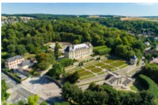
3 Château d'Auvers, drone (2018)