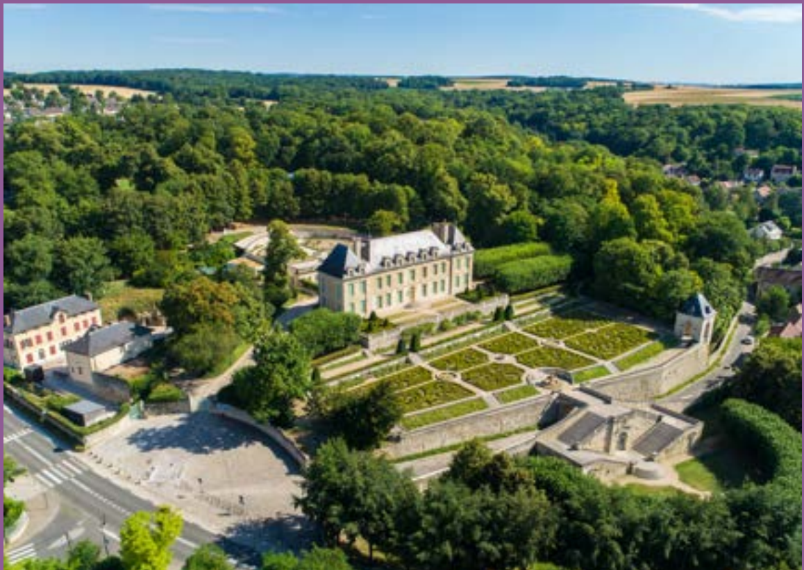
Château d'Auvers, drone (2018)

Plus qu'une simple exposition, ce projet est une invitation à toucher, sentir et découvrir le Château d'Auvers sous toutes ses facettes. Entre frise chronologique, portraits, maquette et dispositifs sensoriels, petits et grands participent à une expérience vivante, poétique et pédagogique. Pensée pour tous les âges, l'exposition offre une découverte ludique et interactive pour les enfants, qui peuvent explorer l'histoire à travers des énigmes et casse-tête. La richesse naturelle du domaine est également mise en lumière, avec un bel hommage au vivant à travers la présentation des jardins et de la faune.