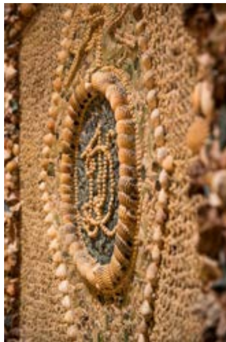
8 Détail du nymphée