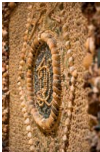
Détail du nymphée © Le Square.

La restauration menée à la fin des années 1980 et au début des années 1990 a permis de restituer l'ensemble des structures et des ornements historiques. Les toitures, les orangeries et les façades ont retrouvé leur esthétique d'origine, tandis que des éléments tels que le cadran solaire sud ou le vase Médicis ont été remis en valeur. Ces interventions ont permis de conserver l'authenticité du château tout en le rendant accessible à la découverte, et de rappeler la richesse et la diversité du patrimoine architectural et paysager d'Auvers.