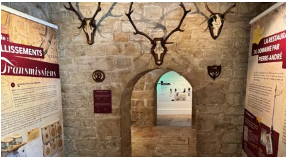
Château d'Auvers, Mémoire d'un domaine vivant, exposition